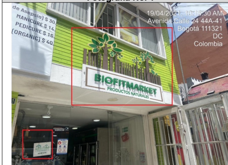
Fachada del establecimiento